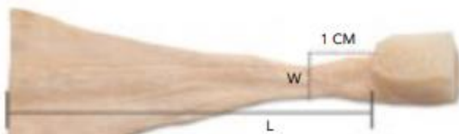
Tendón de Aquiles con hueso