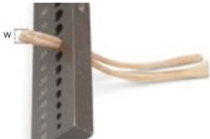
Tendón no óseo (diámetro plegado)